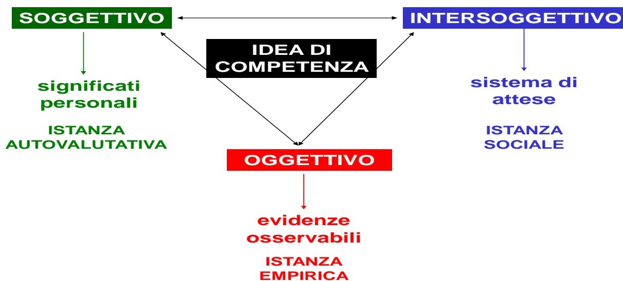
Tav. 4.1 Prospettive di valutazione della competenza.

La Tav. 4.1 sintetizza l'impianto di indagine proposto: una valutazione di competenza richiede di attivare simultaneamente le tre dimensioni di analisi richiamate, attraverso uno sguardo trifocale in grado di comporre un quadro di insieme e di restituire le diverse componenti della competenza, sia quelle più visibili e manifeste, sia quelle implicite e latenti. Il rigore della valutazione consiste proprio nella considerazione e nel confronto incrociato tra le diverse prospettive, in modo da riconoscere analogie e differenze, conferme e scarti tra i dati e le informazioni raccolte. Solo la ricomposizione delle diverse dimensioni può restituire una visione olistica della competenza raggiunta, riesce a ricomporla nella sua complessità.