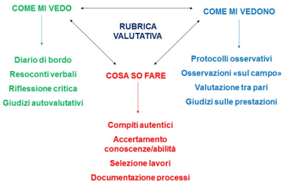
Tav. 4.2 Repertorio di strumenti di analisi delle competenze.

Riguardo alla dimensione intersoggettiva ci si può riferire a modalità di osservazione e valutazione delle prestazioni del soggetto da parte degli altri soggetti implicati nel processo formativo: gli insegnanti, in primis, gli altri allievi, i genitori, altre figure che interagiscono con il soggetto in formazione e hanno l'opportunità di osservarlo in azione. In merito agli strumenti, questi possono spaziare da protocolli di osservazione - strutturati e non strutturati - a questionari o interviste intesi a rilevare le percezioni dei diversi soggetti, da note e commenti valutativi a forme di codificazione