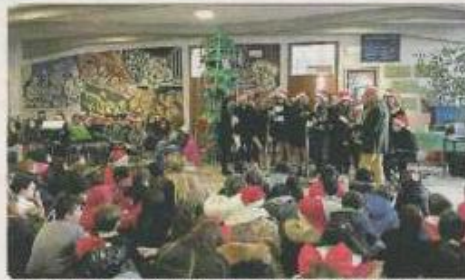
UN NATALE Da tutto esaurito per le recite e i concerti delle scuole

NEL CALENDARIO MESSO IN CANTIERE PER LE FESTIVITÀ C'ERANO ANCHE GLI ALUNNI DI AGORDO