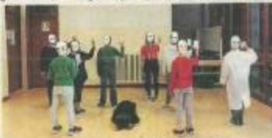
PONTE NELLE ALPI - Una scena dello spettacolo.