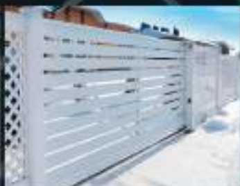
Cancelli automatici Sbarre