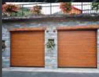
Portoni per garage